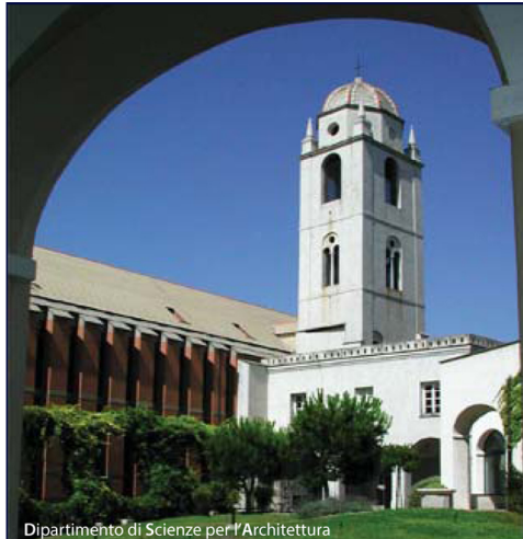
Dipartimento di Scienze per l'Architettura

l'accesso alla scuola è regolato da un esame di ammissione consistente in una prova scritta e in una orale. La selezione avviene generalmente nella seconda metà di ottobre, come indicato dal bando.